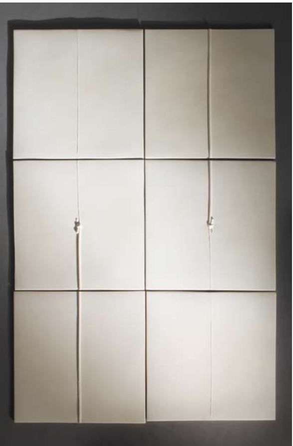
Kirsi Kivivirta Synphyt Born 1959